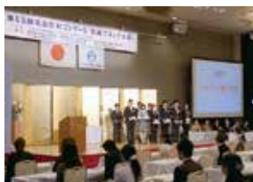
電話応対コンクール