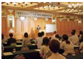
電話応対向上研修