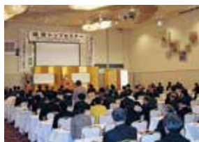
経営トップセミナー