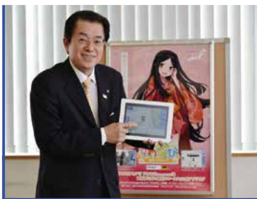
使い勝手のよさを強調する山田勝文諏訪市長。諏訪市のホームページでも自らPRを展開

昨秋、スマートフォン・タブレット端末向けまち歩きナビゲーションアプリ「諏訪市まち歩きナビすわなび」を本格稼働させた諏訪市。アニメ風キャラクターもさることながら、情報内容の充実ぶりや、ユーザー視点の使い勝手のよさに、「行政がここまで？」と驚きや感動の声が寄せられている。先頭に立つて開発指揮とPRにあたった諏訪市長と、実際に開発に携わったお二人に経緯をうかがった。