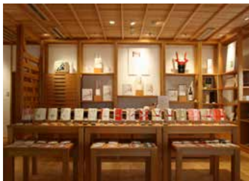
2014年7月にオープンした「つつみや八蔵」

10月には、現在本社にある社員食堂を魚沼の里に移転し、社員だけではなく、一般の方もご利用いただける場所として計画が進んでいます。魚沼に興味を持ってくれる人がもっと増えてもらいたい。これからも地域の活性化に貢献していきたいですね。