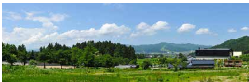
「魚沼の里」は、のどかな田園風景が広がる里山に、八海醸造第二浩和蔵を中心として、「そば屋長森」「うどん屋武火文火」「菓子処さとや」、カフェ・売店・キッチン雑貨店等を併設した「八海山雪室」「つつみや八蔵」など、「郷愁とやすらぎ」を感じるスポットが点在している。www.uonuma-no-sato.jp

いただくお客様のためにも会社を末永く続ける必要がある。しかし、日本酒離れや人口の減少から消費量が激減。清酒オンリーではきびしい時代です。企業を継続するためには一本しかない経営の柱を2本、3本にしていきたい。そこで日本酒を取り巻く食、文化、郷土魚沼などを題材に事業化を進めてきました。