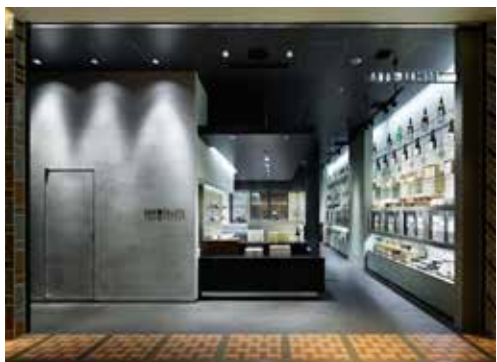
物販だけでなく、お酒の楽しみ方を提案する日本酒Barもある。「八海山 千年こうじや」(東京都中央区日本橋室町2-3-1「コレド室町2」1階)