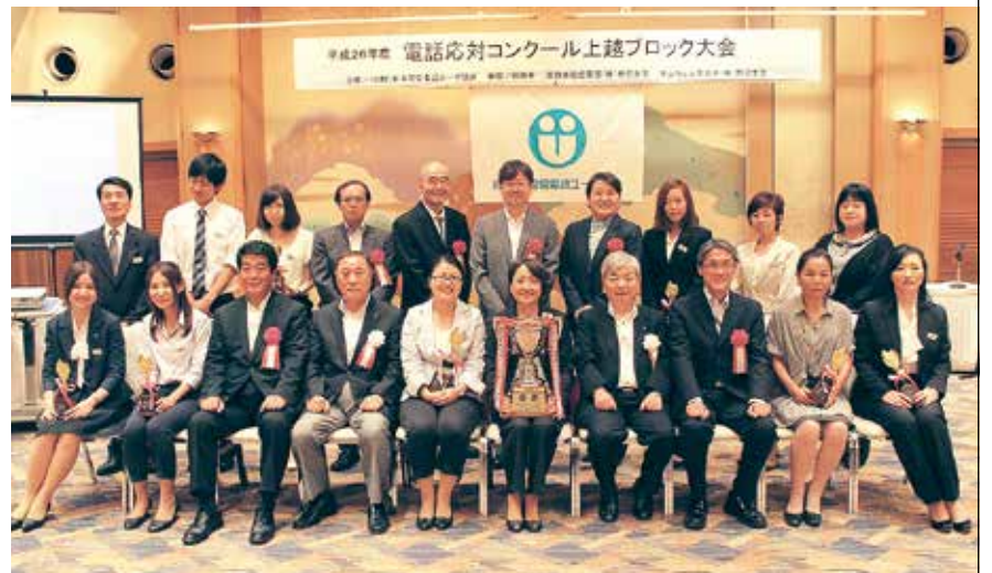
上越ブロック大会の入賞者を囲んで(9月4日(木)、ホテルハイマート/上越市)