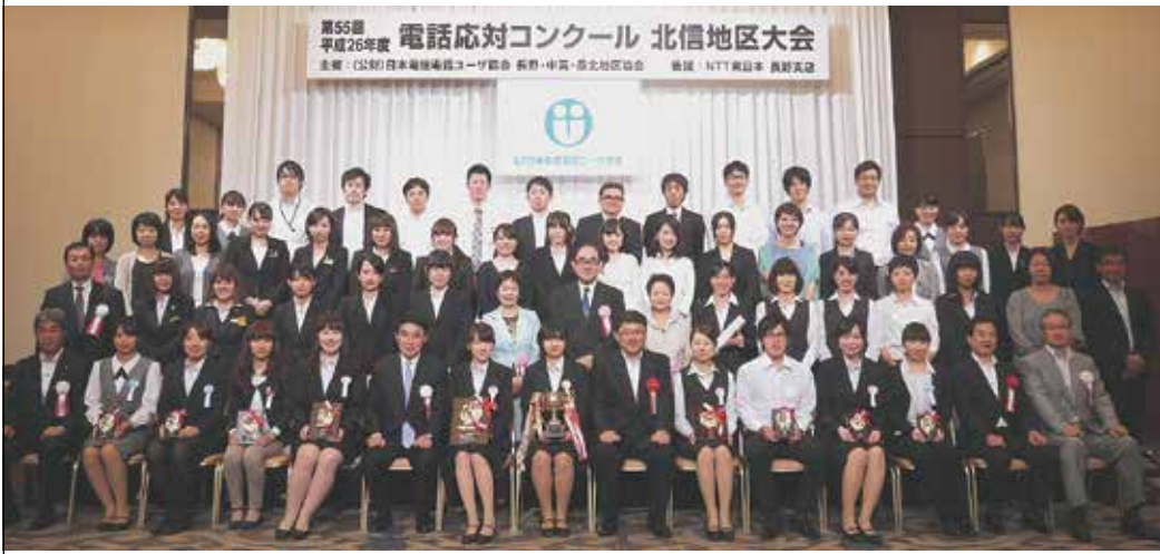
北信地区大会の入賞者を囲んで(9月17日(水)、ホテル国際21/長野市)