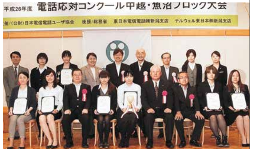
中越・魚沼ブロック大会の入賞者を囲んで(9月17日(水)、会館 青善/長岡市)