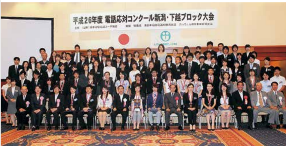
新潟・下越ブロック大会の入賞者を囲んで(9月10日(水)、ホテルオークラ新潟/新潟市)