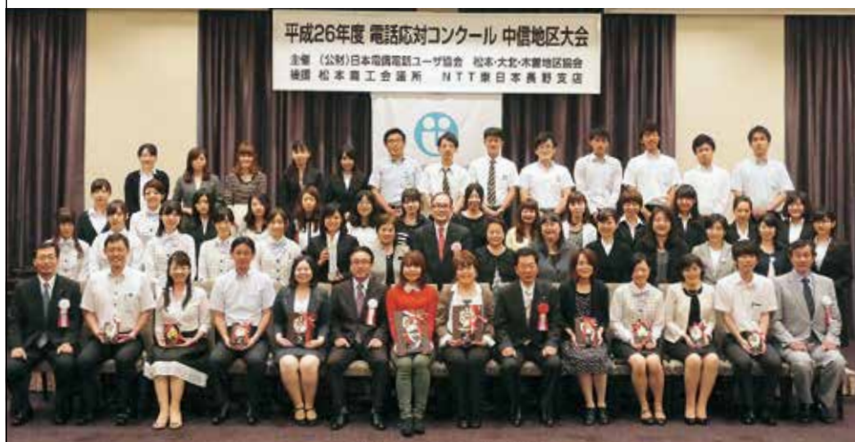
中信地区大会の入賞者を囲んで(9月11日(木)、ザ・ブライツガーデン／松本市)