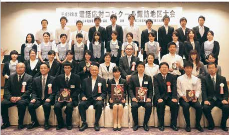
諏訪地区大会の入賞者を囲んで(9月19日(金)、RAKO華乃井ホテル/諏訪市)