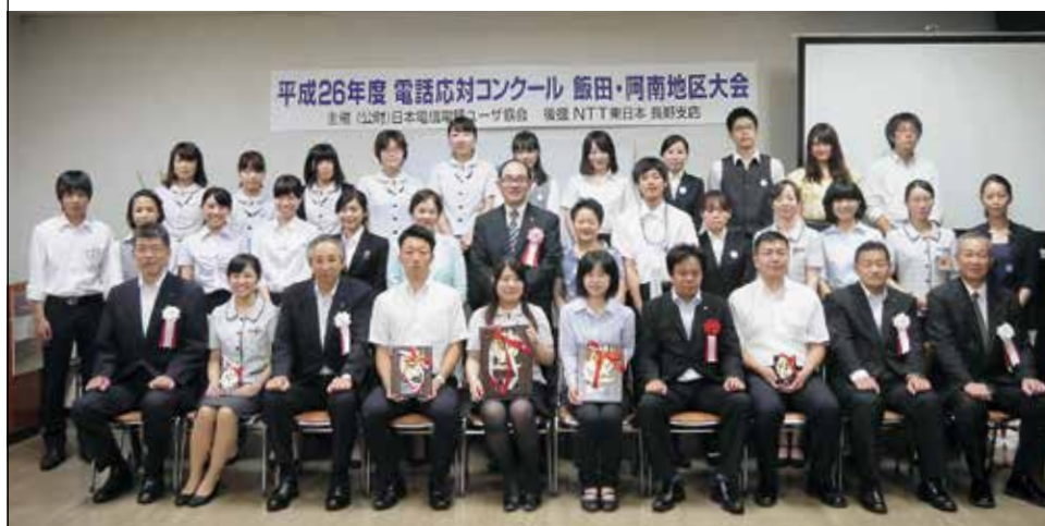
飯田・阿南地区大会の入賞者を囲んで(8月27日(水)、南信州・飯田産業センター／飯田市)