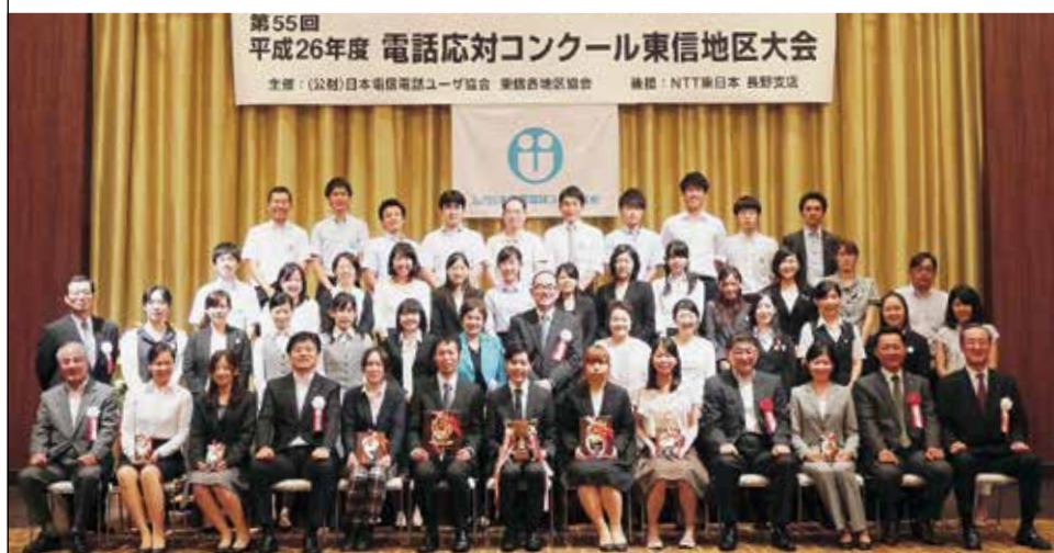
東信地区大会の入賞者を囲んで(9月9日(火)、上田東急イン／上田市)