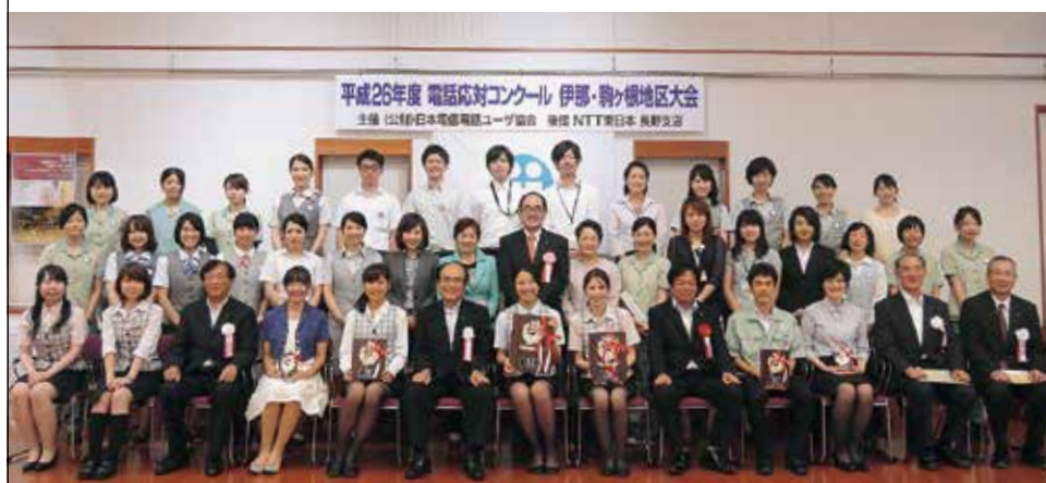
伊那・駒ヶ根地区大会の入賞者を囲んで(9月5日(金)、かんでんぱホール／伊那市)