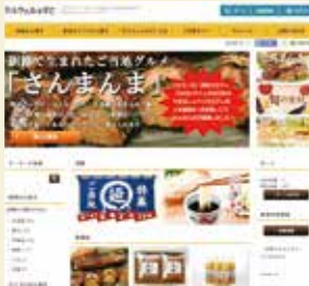
ショッピングサイト「テルウェルeすと」イメージ

更に、eコマースビジネスにも取り組み中で、全国各地の特産品などを集めたインターネットショッピングサイト「テルウェルeすと」(http://twel.jp)を開発しています。