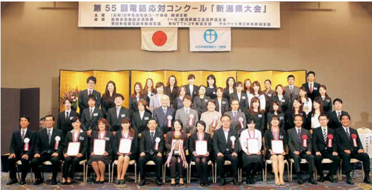
第55回新潟県大会 出場選手を囲んで(平成26年10月2日(木) ANAクラウンプラザホテル新潟)