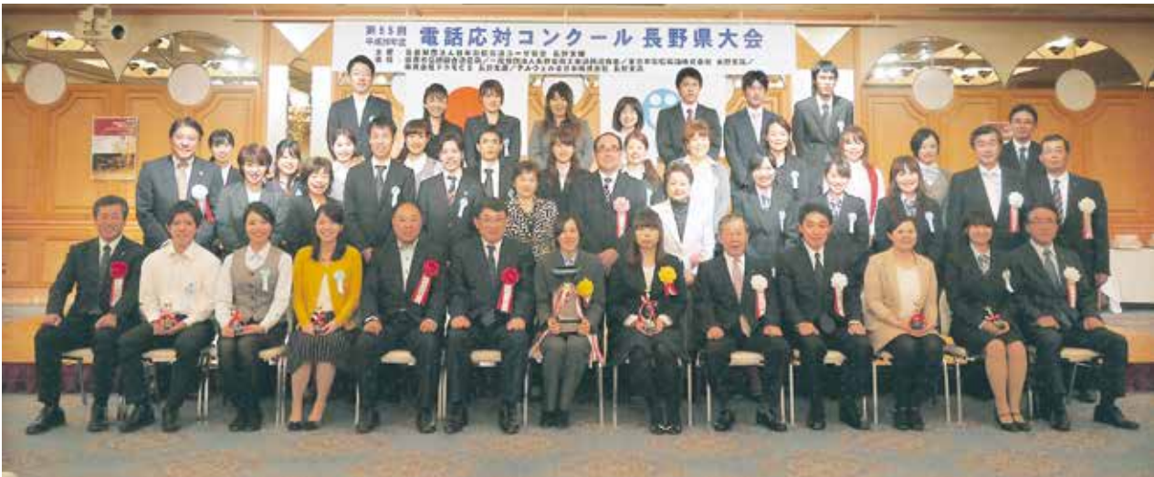
第55回長野県大会 出場選手を囲んで(平成26年10月7日(火) ホテルブエナビスタ)